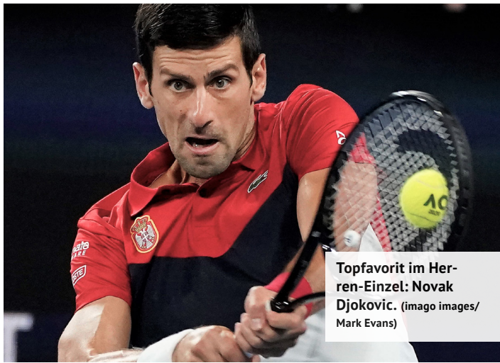
Topfavorit im Herren-Einzel: Novak Djokovic. (imago images/Mark Evans)