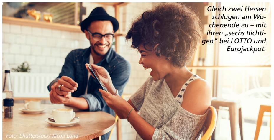
Gleich zwei Hessen schlugen am Wochenende zu – mit ihren „sechs Richtigen“ bei LOTTO und Eurojackpot.

Mit „sechs Richtigen“ zum Jackpot: Dazu kann es bei LOTTO 6aus49 kommen, wenn auch im 13. Anlauf kein Tipper bundesweit einen Volltreffer landet. Nichts Neues für Sie? Aber wussten Sie, dass eine solche garantierte Jackpot-Ausschüttung auch im Spiel 77 möglich ist – und das sogar in dieser Woche? Denn am Mittwoch, 12. Februar, könnten schon sechs richtige Endziffern für den 8 Millionen Euro schweren Jackpot reichen, sollte die Klasse 1 wieder nicht geknackt werden. Zuletzt war es im Oktober 2019 zu einer garantierten Ausschüttung im Spiel 77 gekommen. Gutes Omen für Hessens Tipper: Den damals rund 7,6 Millionen schwere Gewinntopf sicherte sich zur Hälfte ein Mann aus dem Hochtaunus.