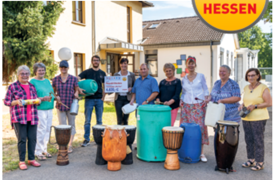
Große Freude bei den „Alten Eisen“ über die finanzielle Hilfe von LOTTO Hessen.

Zum sprichwörtlichen „Alten Eisen“ will wohl keiner von uns zählen. Und doch haben sich die Teilnehmer der gleichnamigen Trommelgruppe am Pluspunkt Erbenheim ihren Namen bewusst ausgesucht. Gemeint sind damit natürlich nicht sie selbst, sondern die Alltagsgegenstände, mit denen sie faszinierende Rhythmen erzeugen. Einmal die Woche treffen sich die Trommler dazu in den Räumen in der Wiesbadener Lilienthalstraße, um so auch ihre eigene Fitness zu stärken. Seit Herbst 2018 gibt es das Angebot der Bildungs- und Begegnungsstätte der evangelischen Paulusgemeinde Erbenheim – dank der finanziellen Unterstützung von LOTTO Hessen.