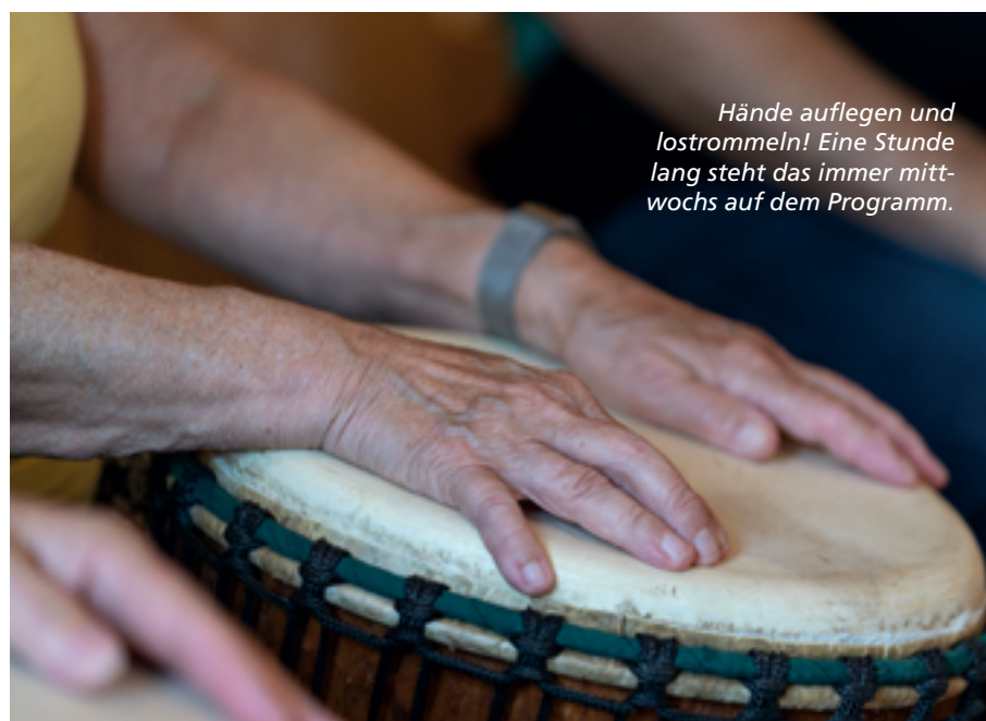
Hände auflegen und lostrommeln! Eine Stunde lang steht das immer mittwochs auf dem Programm.

Denn von jedem Euro, den die hessischen Tipper einsetzen, kommen rund 20 Prozent dem Gemeinwohl zugute. Neben sozialen Einrichtungen profitieren davon auch Projekte in den Bereichen Denkmalpflege, Kultur, Sport und Umwelt. Allein im vergangenen Jahr konnten so insgesamt rund 135 Millionen Euro für gemeinnützige Projekte in den genannten Bereichen zur Verfügung gestellt werden. Ganz nach dem Motto: LOTTO hilft Hessen!