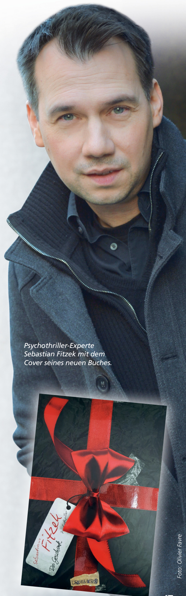
Psychothriller-Experte Sebastian Fitzek mit dem Cover seines neuen Buches.